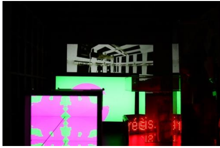
『COLLAGE CITY』、Grande Halle de La Villette、 パリ、2018 年