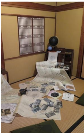
『対蹠点』、〈それを見たと言う〉、 ギャラリー蔵蔵、新潟市、2015 年

https://www.matsuzawayutaka-psiroom.com/