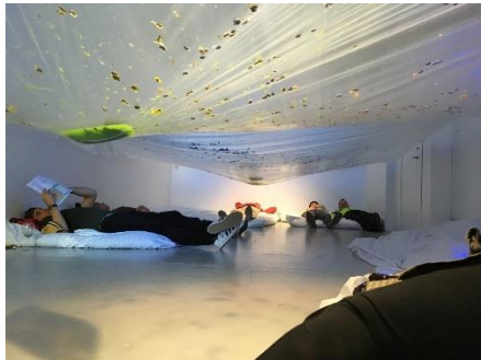
『CALL FOR PERFORMERS -onirisme collectif-』、 Midpunkt, レイキャヴィック, アイスランド、2019年

2011-14年 Resort（横浜）を運営。主な展示に2013年「原子力 明るい未来の エネルギー」（Resort、横浜）、2012年「まちづくりのためのプロジェクト／黄金町」（Resort、横浜）、2007年「LOCKER GALLERY at TOKYO NATIONAL MUSEUM」（東京国立博物館）等。今夏、「明るい未来のための記念塔」（銀座、東京）発表予定。 http://futoyu.com