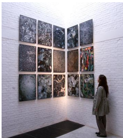
『disCONNEXION』、〈Convection〉、Three Shadows Photography Art Centre、北京、2007 年