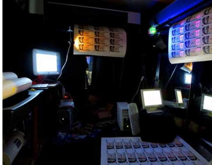
『FUTOYU GINKO - ZERO』、〈NO MAN'S LAND〉、 広尾の旧フランス大使館、東京、2010年